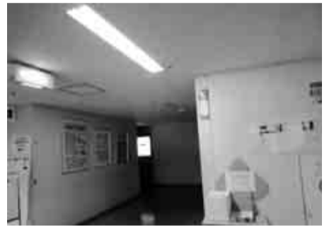
備え付けのアンケート用紙でご回答をお願いします

これは、意欲的な防災活動を行う団体を「東京防災隣組」として認定し、広く紹介することによって更なる取り組みを