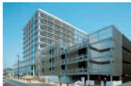
新庁舎立体駐車場（写真手前）

○来庁者用駐車場や市民協働専用空間など市民利用施設が充実します。また、1階に設置する「イベントスタジオ」では、観光やスポーツなどの情報を発信したり、コンビニエンスストアでは、町田の名産品を販売するなど、市の情報発信の充実や市内経済の活性化を図ります。