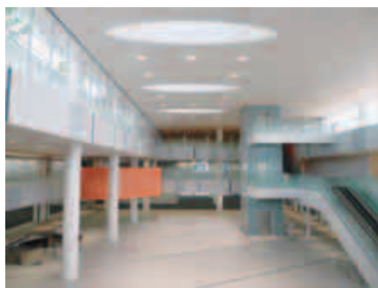
ワンストップロビー（1階）

○市民利用の多い部署を1・2階にまとめて配置します。このメリットを生かして、来庁者がなるべく1か所で用事を済ませることができるサービス（ワンストップサービス）を実現していきます。また、議会の傍聴がしやすいように議場を低層階の3階に配置するなど、市民の皆さんにとって使いやすい庁舎になります。