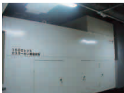
非常用自家発電設備