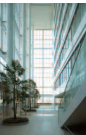
アトリウムによる温熱環境負荷軽減