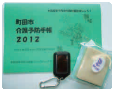
介護予防手帳と参加者への景品

いつまでも元気に暮らすためのヒントが満載です。 市や高齢者支援センターで開催する介護予防講座などに参加する際に、参加帳としても活用できます。参加回数が多い方には景品もご用意しています。介護予防手帳・景品の説明・配布は高齢者支援センターまたは高齢者福祉課で行っています。ぜひ健康づくりのパートナーとして日々ご活用下さい。