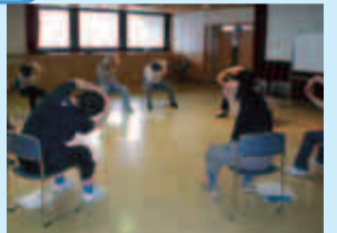
体験型セミナーでの体操

保健指導に参加している方 には、体験型セミナー（食 事・運動・歯科）も実施し ています。