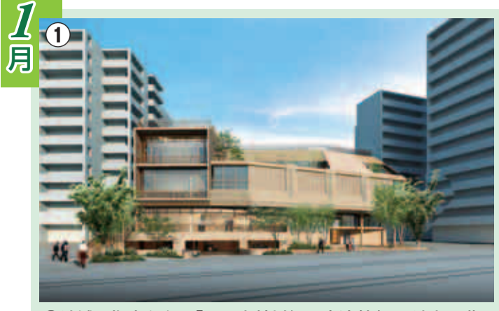
①地域の拠点となる「町田市鶴川緑の交流館」は、地上4階・地下2階建てで、300席の多機能ホールや図書館機能、駅前連絡所機能などをもつ施設です。太陽光発電、テラス緑化、雨水利用など環境にも配慮しています。(写真は完成予想図)