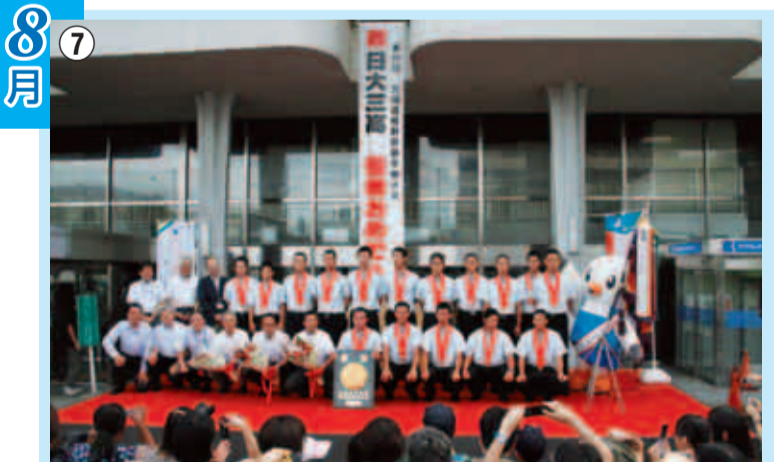
⑦日大三高野球部が夏の甲子園で見事全国優勝！ 8月25日に市役所前で行われた報告会では大勢の皆さんが祝福しました。