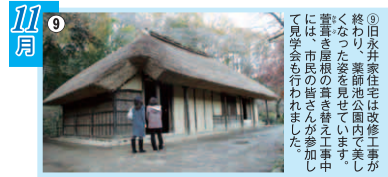
⑨旧永井家住宅は改修工事が終わり、築師池公園内で美しくなった姿を見せています。萱葺き屋根の葺き替え工事中には、市民の皆さんが参加して見学会も行われました。