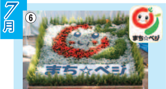
⑥「まち☆ベジ」マークの入ったのぼり旗が立っているお店で、町田産の野菜が購入できます。11月に開催された「キラリ☆まちだ祭」の会場にも、花でかたどった「まち☆ベジ」が登場しました。

2011年も残りわずかとなりました。3月に東日本大震災が発生、東北・関東地方を中心に甚大な被害をもたらし、市内でも商業施設の倒壊による死亡事故や多数の帰宅困難者が発生しました。また、原発事故の影響で大きな不安が広がりました。市では、地震直後から被災地に物資の提供や職員派遣等の復興支援を継続して行っています。夏には、電力不足による節電対策の一環で、多くの方々がクールビズや緑のカーテンづくりに取り組みました。今年も東日本大震災の発生を機に、一人ひとりの防災意識が高まり、人のつながりの大切さを改めて実感した1年でした。市も、町田市地域防災計画の見直しを行っています。ここでは、市政を中心に1年間を振り返ってみました。