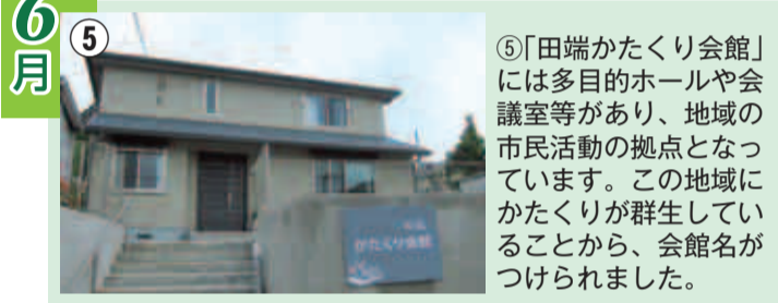
⑤「田端かたくり会館」には多目的ホールや会議室等があり、地域の市民活動の拠点となっています。この地域にかたくりが群生していることから、会館名がつけられました。