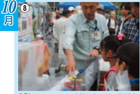
⑧「町田エコフェスタ2011」では、子どもから大人まで大勢が参加し、広く環境問題についての発表や展示を楽しみました。