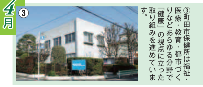
③町田市保健所は福祉・医療・教育・都市づくりなどあらゆる分野で「健康」の視点に立った取り組みを進めています。