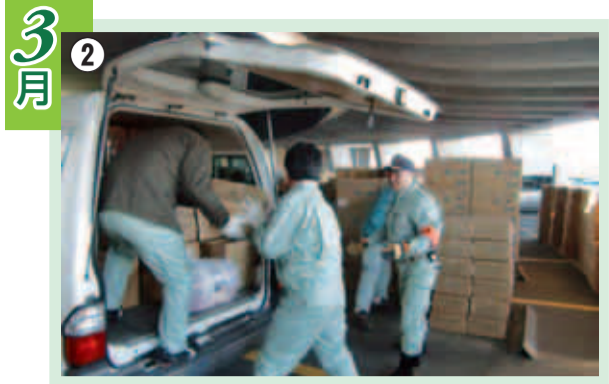
②東日本大震災の被災地に職員を派遣して、市民の皆さんからお預かりした救援物資を届けたり、地震の被害判定・ごみ処理・健康相談等を行いました。支援は今もさまざまな形で続いています。写真は3月26日に第2陣の派遣職員が救援物資を届けている様子です。