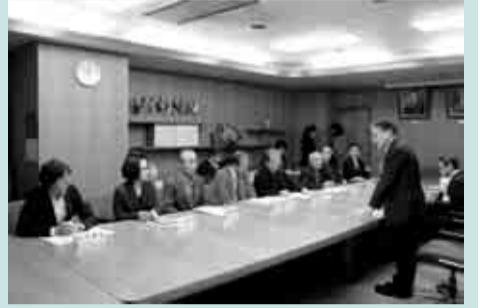
報告書の提出を受けた後、石阪市長（手前側）と委員の皆さんが懇談しました

市庁舎は、現在森野に建設中の新庁舎へ来年7月移転します。これに伴い、市では現庁舎の跡地活用について検討を進めています。