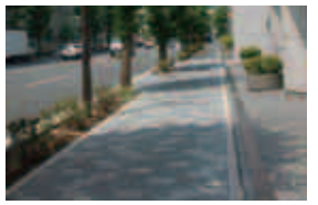
インターロッキング(事例)