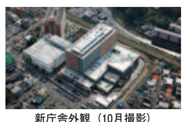
新庁舎外観 (10月撮影)

11月も下旬になり、紅葉の美しい季節になりました。新庁舎では、10月に足場が解体されてから、きれいに紅葉したような「赤茶色」のタイルで覆われた壁が、遠目からでも見えるようになりました。