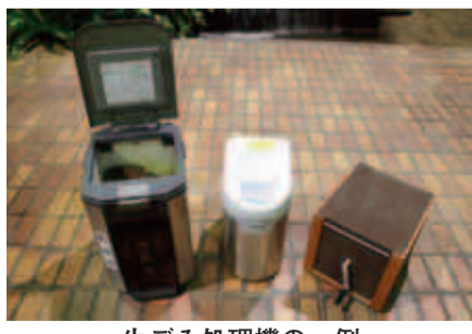
生ごみ処理機の一例