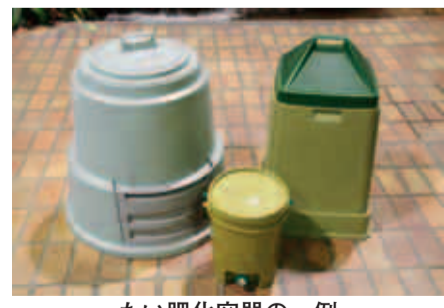
たい肥化容器の一例

集合住宅にお住まいの方へ 大型生ごみ処理機を無償で貸し出しています。詳しくは、ごみ減量課へお問い合わせ下さい。