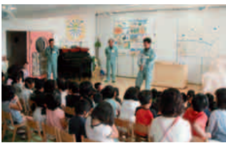
職員手作りの紙芝居です

として、主に小学生を対象に行っていた「ごみと資源の出前講座」を、今年から保育園・幼稚園児向けにアレンジし、小さい頃から「ECCO(エコ)」に親しんでもらえるようリニューアルしました。職員手作りの「ごみ収集車のうた」の合唱や踊り、環境をテーマにした紙芝居など、園児たちにも分かりやすい楽しい内容です。