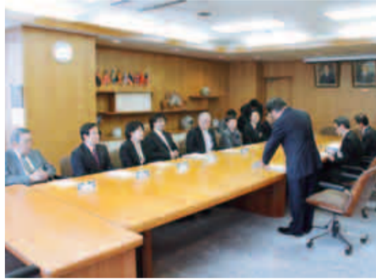
答申後に市長(手前中央)と各委員が懇談

に、「ごみになるものを作らない・燃やさない・埋め立てない」を原則として、徹底したごみ減量、資源化を図りつつ持続可能な環境負荷の少ない都市を目指します」としています。