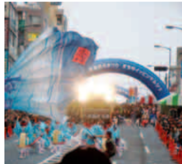
町田夢舞生ッスイ祭のよさこい踊り

まちだの産業と農業のフェスティバル「キラリ★まちだ祭」を、原町田大通りなど4か所を会場に開催します。町田市内の事業所による商品・製品等の販売やPR、町田の農業が誇るキラリと光る農産物の品評会・即売会等、楽しめるイベントが盛りだくさんです。また、「町田夢舞生ッスイ祭」も同時開催するほか、東北観光物産コーナーと銘打って、被災地からの物産展も開催します。