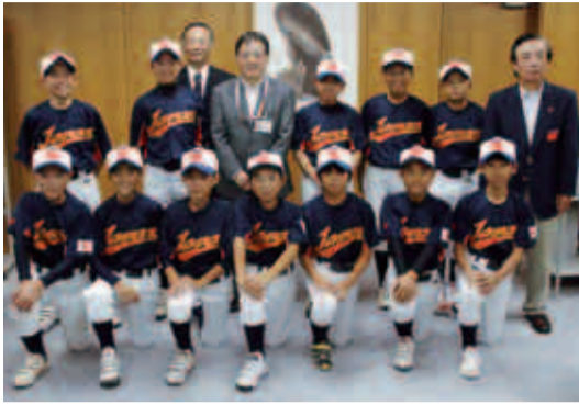
“JAPAN”と大きく書かれたユニホームで、それぞれ大会での抱負を話してくれました

シンガポールで開催された「第8回南アジア少年軟式野球大会」へ日本代表としての出場を決めた町田市の少年軟式野球チームが、その報告のため大会前の9月27日に市役所を訪れました(写真)。