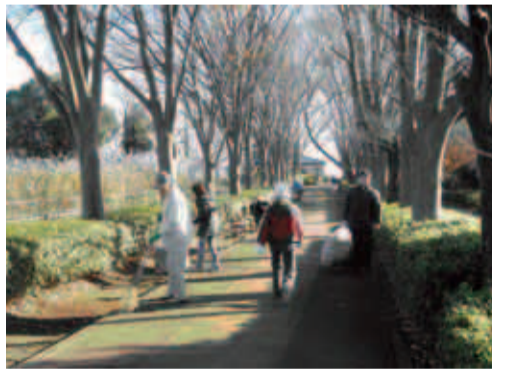
活動中のけやき会