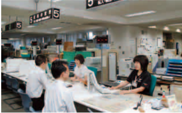
市民課の証明発行サービスが拡大されます

問 市民税課 ☎724・2874 FAX724・1177 市民課 ☎724・2864 FAX724・1180