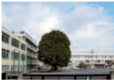
校庭では町田市の名木百選に選ばれた大きな「くすのぎ」が児童を見守っています

9月1日 から「 忠生第一小学校 」の名称が「 忠生小学校 」に変わります 市立忠生第一小学校は、開校100周年を機に「忠生小学校」に名称を変更します。