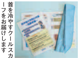
首を冷やすクールスカーフをお届けします

これで、第4次高齢社会総合計画に基づく特別養護老人ホームの開設は、3施設目を迎えました。今後は、2011年度に2施設、2012年度に1施設の開設を予定しています。 関高齢者福祉課 ☎724・4048 FAX 724・1190