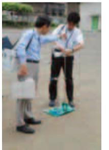
地上1mと5cmで測定しました

測定方法 ○測定器 アロカTCS166(シンチレーション式サーベイメータ) ○測定数 30秒 ○測定方法 5回の繰り返し測定による平均