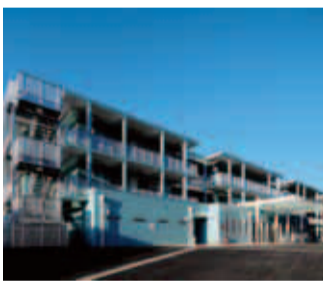
ヴィラ町田(相原町4391-7)

相原町に「介護老人福祉施設ヴィラ町田」(定員200人)が完成し、7月1日から利用が開始されました。