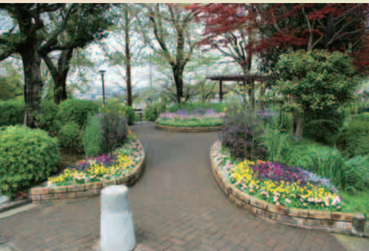
最優秀賞 つくし野貝がら公園 反対色を多用した組み合わせが人目を引きつける鮮やかな色調の花壇です。桜の木の下で日当たりが良くない中、元気で鮮やかな花色と手入れの良さが評価されました。