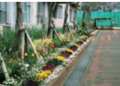
優秀賞 都立成瀬高校