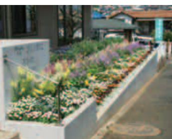
優秀賞 ききょう保育園

で、今年度の受賞者が決定しました。参加した361団体の中から、審査の結果、最優秀賞につくし野貝がら公園花とみどりの会、優秀賞に境花だん、ききょう保育園、都立成瀬高校おはなばたけの3団体が選ばれました。 また優良賞に20団体が、努力賞に26団体が選ばれました。受賞団体などコンクールの詳細は、町田市ホームページでご覧いただけます。 問 公園緑地課 ☎793・7612 FAX793・7617