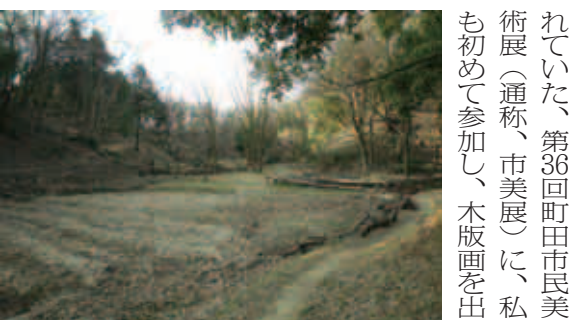
三輪緑地内の谷戸

支給対象になりません。 ④申請書類を直接子ども総務課(市役所本庁舎9階、☎724・2143)へ。 ※障がいの状況により必要書類が変わります。申請する方はお問い合わせ下さい。 ※郵送での申請はできません。 国民健康保険・高齢受給者証(更新証)を お送りします 現在「国民健康保険高齢受給者証」をお持ちの方へ、4月1日からお使いいただく受給者証を3月18日に世帯主の方に発送します。 65歳以上で障害認定を受けていて、後期高齢者医療被保険者証をお持ちの方は該当しません。 年度の切り替えが8月1日のため、今回お送りする受給者証の有効期限は7月31日まで、現在と同じ負担割合となります。 ④国民健康保険課☎724・2124 ⑤忠生土地区画整理事業、換地計画 町田市計画忠生土地区画整理事業の換地計画(新たな町名、地番、地積及び清算金等)が次の日程で縦覧できます。 ③3月17日〜30日の午前9時〜午後5時 ※土・日曜日、祝日も縦覧できません。 町田役所本庁舎2階 ※縦覧期間中、利害関係者は、意見書を提出することができ。3月30日まで(消印有効)に直接または郵送で区画整理課(〒194-0003 3、木曾町2185-1、☎792・3771)へ提出して下さい。