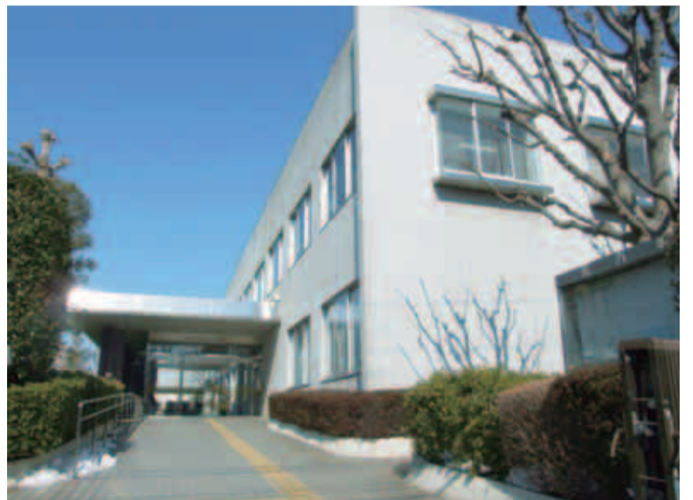
現在の「東京都町田保健所」が4月1日から「町田市保健所」になります