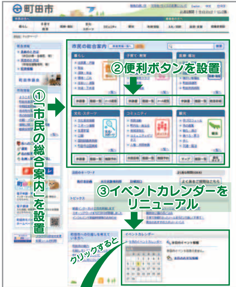
イベントカレンダー

リニューアル後のホームページに、市民生活に関連の深い広告を募集中です。詳細は広報広聴課(☎724・2101)へお問い合わせ下さい。