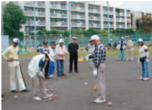
昨年10月に行われた、シルバー親善ゲートボール大会

さまざまな人と交流を深めながら、心身共に元気になれるスポーツです。興味のある方はお気軽に町田市ゲートボール協会(原町田4-24-6、せりがや会館内、☎722・22503)へお問い合わせ下さい。