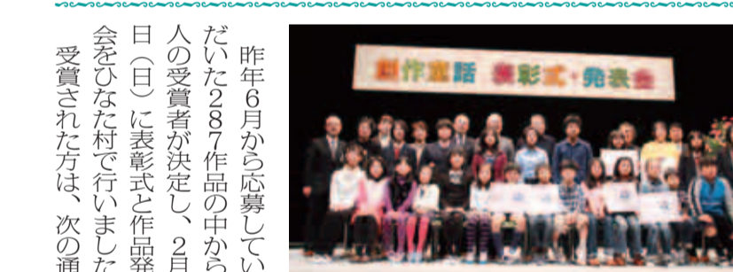
来場した受賞者の皆さん