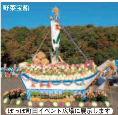
野菜宝船 ぼっぼ町田イベント広場に展示します

◆東急会場◆ 町田夢舞生ッスイ祭Ⅱ 本場高知のチームのほか全40チームが参加するよさこい踊りです。 ◆109会場◆ まち中イッピンマルシ