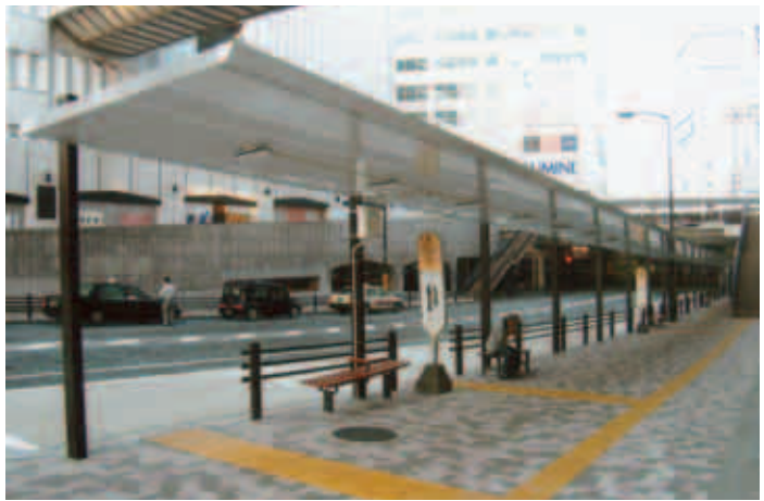
原町田大通り(都市計画道路3・4・11号線)沿いの町田東急ツインズWEST前のバス停に屋根が設置されました。屋根は幅2.4m、長さ約59mです。 ☎都市計画課709・0614 FAX709・0598