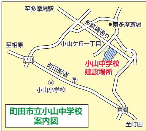
町田市立小山中学校案内図