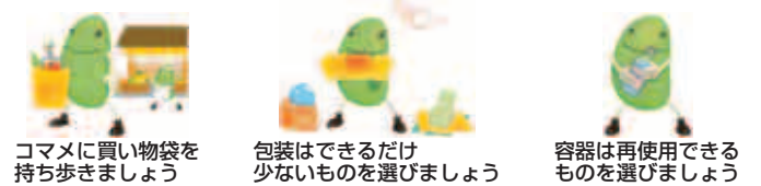
コマメに買い物袋を持ち歩きましょう