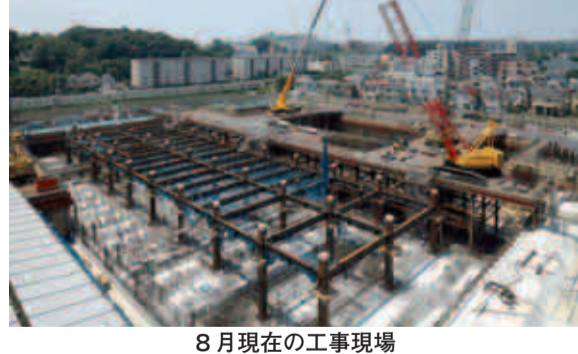
8月現在の工事現場

2年秋の予定です。 ※今後も工事の進捗状況をお伝えしていきます。 夏休みイベントが開催されました! 7月24日に庁舎新築工事現場では、小学3年生から6年生までとその保護者を対象に「親子で体験、現場の日」が開催されました。このイベントは、市との協定に基づき、施工者である鹿島建設株式会社が行ったものです。 当日は、39人が参加し、新庁舎のペーパークラフト作成や建設重機の試乗体験などが行われました。 当日の様子や町田市庁舎新築工事協定書の内容は、町田市ホームページ(市政情報)新庁舎計画)または町田市庁舎新築工事事務所ホームページ( http://www.machidashinc-youshikense.tsu.com/ )からご覧いただけます。