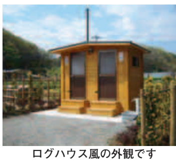
ログハウス風の外観です

現在配布中の「生涯学習N A V I 15」ページに掲載されている、公開講座「町田の郷土史I 古代の町田」流れ込む文化と生産」は都合により中止となりましたのでお知らせ