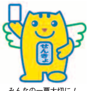
みんなの一票大切に!