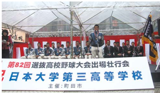
第82回 選抜高校野球大会出場壮行会 日本大学第三高等学校 主催：町田市