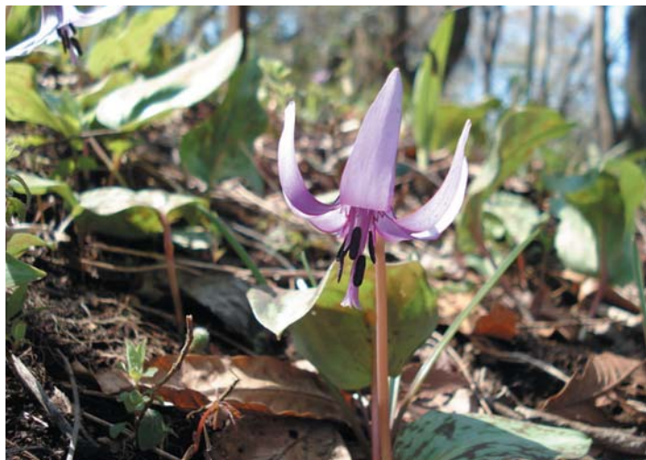
ひっそりと咲くカタクリの花 昨年4月撮影

「町田かたかごの森」は、毎年カタクリの開花時期に合わせて開園しています。この森には、多摩の希少種カタクリをはじめ、イチリンソウ、ヒトリシズカなどの野草も多く自生しています。