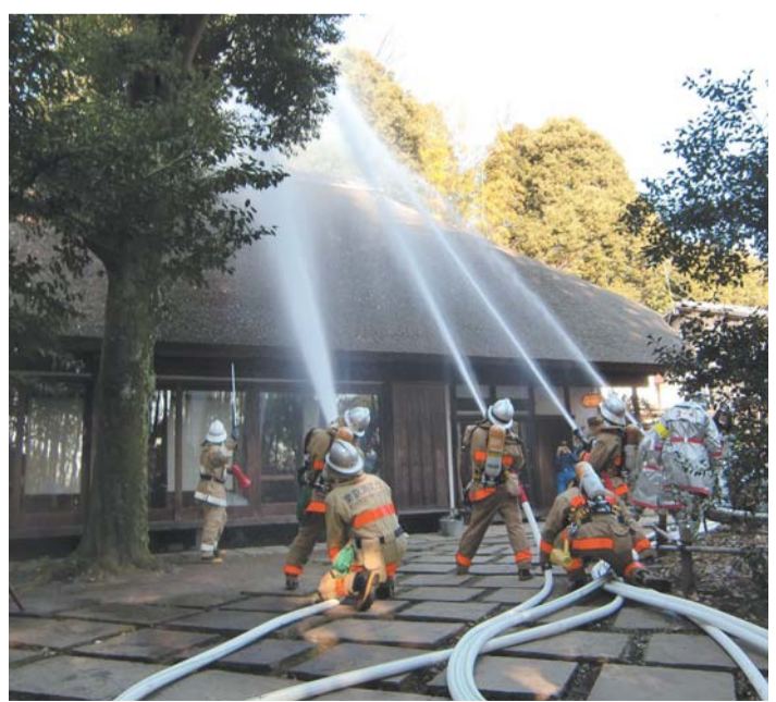
演習での町田消防署、町田市消防団による一斉放水