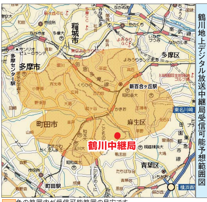
色の範囲内が受信可能範囲の目安です。ただし、中継局方向が見通せない等により、受信できない場合もあります。

3月下旬に「鶴川地上デジタル放送中継局」が開局し、地上デジタル放送を開始します。これにより、受信が困難であった鶴川地区周辺でも地上デジタル放送の受信ができるようになります。地上デジタル放送を受信するには、地上デジタル放送対応のUHFアンテナと受信機が必要です。詳しい受信方法については、デジサポ東京西