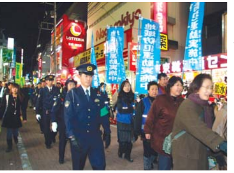
町田市・相模原市から市民も含め約400人が参加しました

町田市市民ホール ☎ 728・4300 ※電話はおかけ間違いのないようにお願いします。 ※受付時間 午前8時30分～午後5時(土曜日のみ)