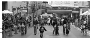
市制50周年記念事業「まちだ街なか大運動会」