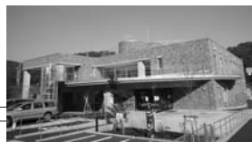
子どもセンターばお