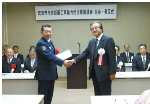
暴力団排除協議会の発足式で暴力団排除宣言が行われました

※議会議中継はインターネットでもご覧いただけます。 ※会議の日程・時間等は変更になることがあります。