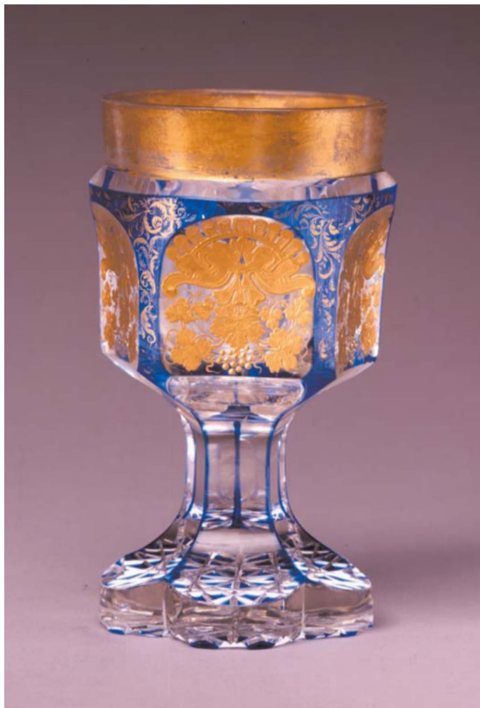
透地青被葡萄文ゴブレット ボヘミア 19世紀 高さ17.8cm

青と金が目に鮮やかなゴブレットです。ゴブレットとは、飲み物を入れる器を指します。この作品ではワインの原料である葡萄の文様が、金彩によって丁寧に表現されています。底部に施されたカットも、見どころのひとつです。