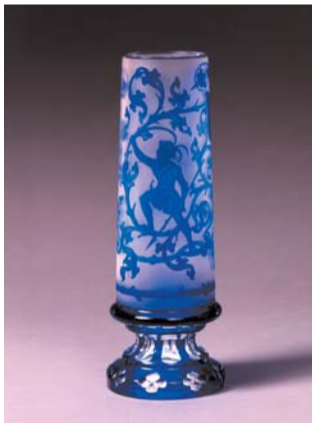
透地藍被狩猟文 ゴブレット ドイツ 19世紀 高さ31.0cm

青と金が目に鮮やかなゴブレットです。ゴブレットとは、飲み物を入れる器を指します。この作品ではワインの原料である葡萄の文様が、金彩によって丁寧に表現されています。底部に施されたカットも、見どころのひとつです。