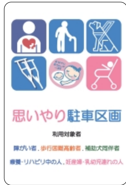
この看板が目印です