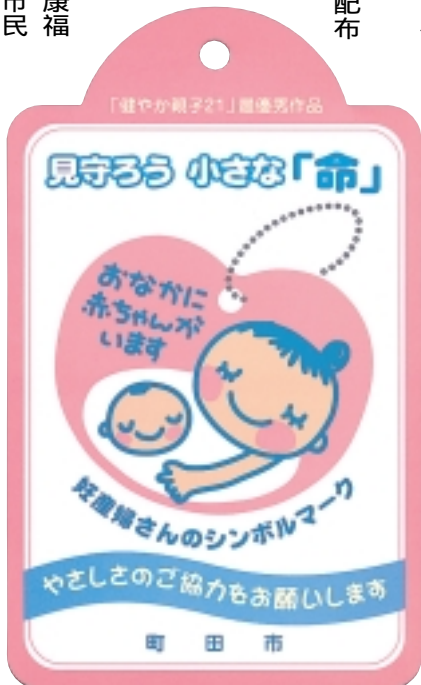
妊婦さんが乗っています。優しい運転を