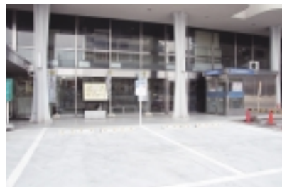
市役所本庁舎では正面入口横が思いやり駐車区画です