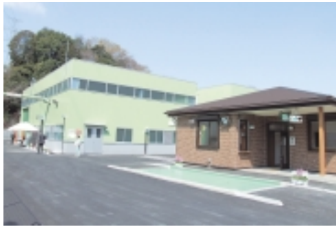
小野路町に剪定枝資源化センターがオープンし、剪定枝のリサイクルが本格稼働しました。集積所で資源として集められた剪定枝は、畑などの土壌改良材(たい肥)になります。 4