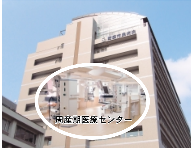
周産期医療センター

2005年から着手していた市民病院第2・第3期増改築事業が完了し、5月1日から新病棟(南棟)が開院、緩和ケア病棟などが新設されました。また、10月には周産期医療センターもオープンし、最新の設備を備えたNICU(新生児集中治療室)6床を新設しました。