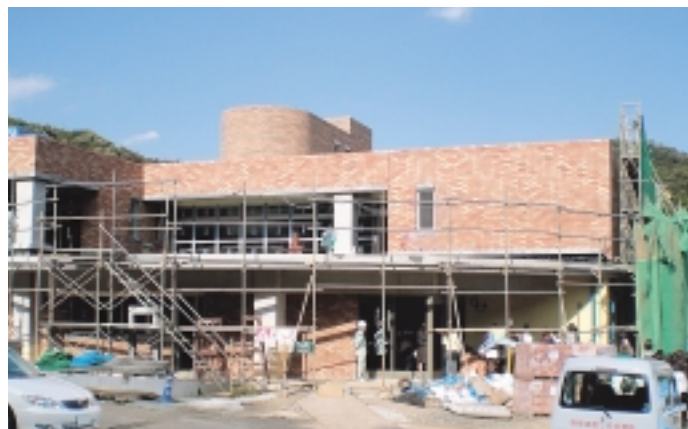
着々と工事が進む(仮称)相原子どもセンター(10月28日撮影)

条例「町田市計画下水道事業受益者負担に関する条例の一部を改正する条例」町田市民病院使用条例の一部を改正する条例」などが議案として提案されています。