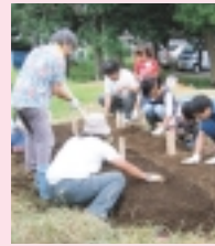
恵泉女子大学「親子野菜づくり教室」

この他にも子どもから大人までを対象としたイベントやシンポジウムなどを実施しています