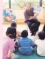
玉川大学「子ども英語サマースクール」

この他にも子どもから大人までを対象としたイベントやシンポジウムなどを実施しています