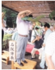
昨年もにぎわいました

この懇談会では下表に示した5つのテーマについて、専門委員との意見交換を通じて、地域の活性化を図るための有効なコンセプトを見出し、今後の取り組みに生かしていきます。