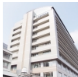
周産期医療の充実を図る町田市民病院