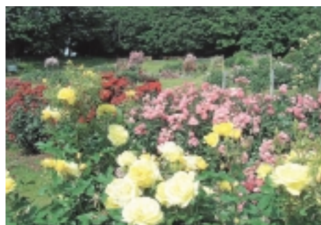
昨年6月上旬頃の様子