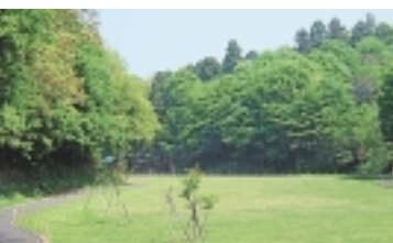
ぐるりと園路のある芝生広場