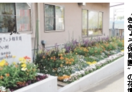
「ききょう保育園」の花壇

いにする会、ふよう病院グループホームあおぞら中庭ボラティア隊、忠生中学校 優良賞：「花の町相原」境花だん、せんげんフラワー、本町田住宅花とみどりの会、金森クイーンチェリーガーデン、成瀬グリーンセンター、高ヶ坂保育園、さくらんぼホール施設委員会、金森イレブンチェリーガーデン、町田市教育センター花を愛する会、つくし野スクエアアール花とみどりの会、金森サーティーンチェリーガーデン、小川小学校、町田第五小学校 努力賞：クラフト工房・まの、小山緑クラブ長寿会、元橋花の会、春蘭の会、和光台「花の道ボランティア」、小山田桜台1・5団地管理組合、花ロード玉川、高北自治会「花の会」、旭町二丁目フレッシュ・クラブ、CPM