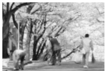
きれいな桜並木は、地域の人たちの手で守られています

街路樹や電柱に掲出された違反広告物は環境を悪化させるだけでなく、時には交通の支障にもなりかねません。違反広告物除却員制度はこれらの違反広告物を市民ボランティアの皆さんに除却していただく制度です。