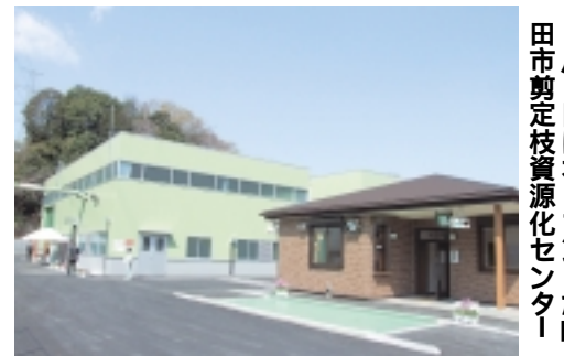
4月1日にオープンした町田市剪定枝資源化センター

これらは「燃やせるごみ」の日に45リットルまでの大きさの透明または半透明の袋(指定収集袋以外)で、2袋まで無料で出すことができます(1本の太さは直径10cmまで)。 問 剪定枝の資源化に関すること こみ減量課 ☎797・0530、剪定枝の収集に関すること 清掃事務所 ☎797・7111