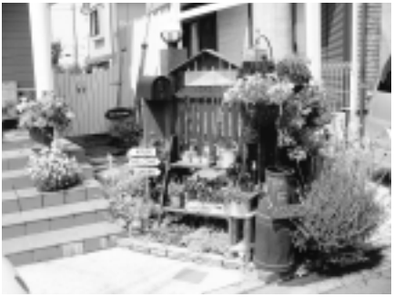
2007年度「花のまちかどコンクール」入賞作品

審査・表彰 5月中旬に、安らぎと潤いを与えてくれることや、デザインの美しさ、草花の手入れの状態などの観点で審査し、「花のまちかど大賞」などを決定します。 申し込み 応募・推薦書(公園緑地課、または市役所本庁舎市民相談室前及び、各市民センター、各図書館内の