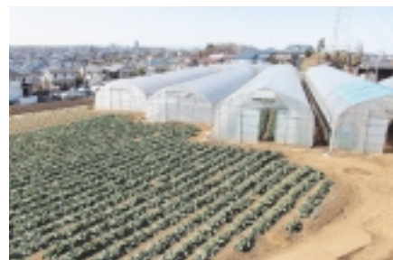
住宅街の中のつくし野の畑