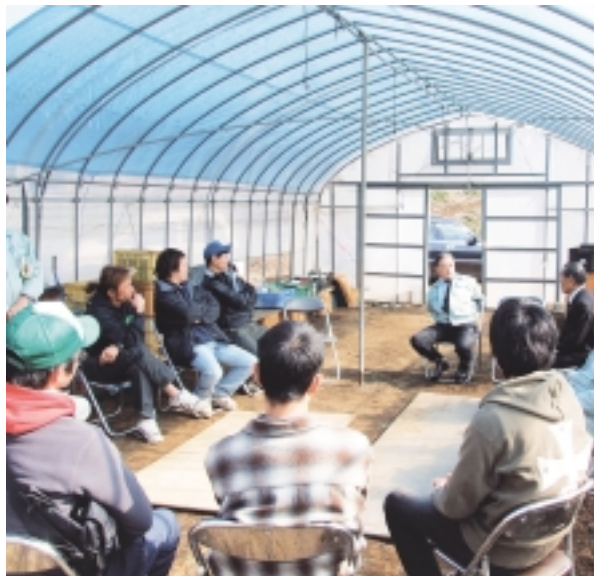
ビニールハウスの中で、活発な意見交換をしました

現在、市内には40人の青壮年部会員があり、日々安全・安心な農産物の生産に努めています。最後に市長から青壮年部に対し「エールが贈られました。今回の懇談は、市内で活動する団体等の活動場所に市長