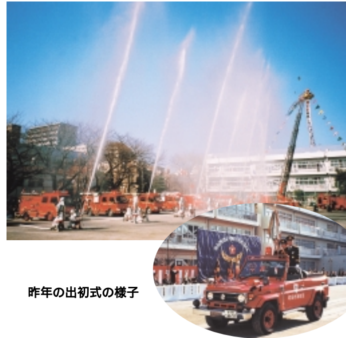
昨年の出初式の様子

税金の申告時期になると、税務職員や町田市職員をよそおい「税金や医療費などの還付金がある」からと口座番号等を聞きだしたりする不審な電話が多発しています。町田市では、市・都民税、固定資産税、国民健康保険税、介護保険料、医療費等の還付金は、市長名の文書により通知しています。 通知もなく、職員が口座番号を聞きだしたり、ATMを使用するよう指示したりすることはありません。 還付金の関係で不審な電話がありましたら「振り込め詐欺」の可能性があるので、市の担当部署、または安全対策課にお問い合わせ下さい。 問 安全対策課 ☎724・3254