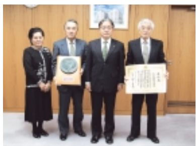
11月28日に報告のため、市長を訪れました

同町内会は会員世帯数4000を数える市内最大の町内会です。今回の受賞は、地域資源回収活動、防犯パトロール活動をはじめ、地域の課題であった交通問題の解決に向け、バス事業者・町田市と協働でコミュニティバスの導入