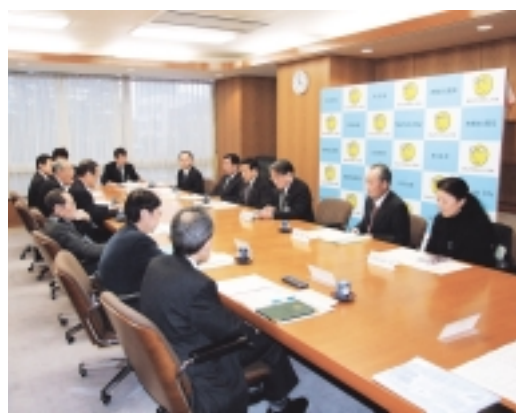
第1回の委員会が開催されました

11月28日、市内の企業、各種団体及び市で構成される町田市市制50周年記念事業実行委員会が開催されました。委員長である石阪市長によるあいさつ後、実行委員会の会則、役員選任、2007年度事業計画及び予算が承認されました。最後に、記念事業