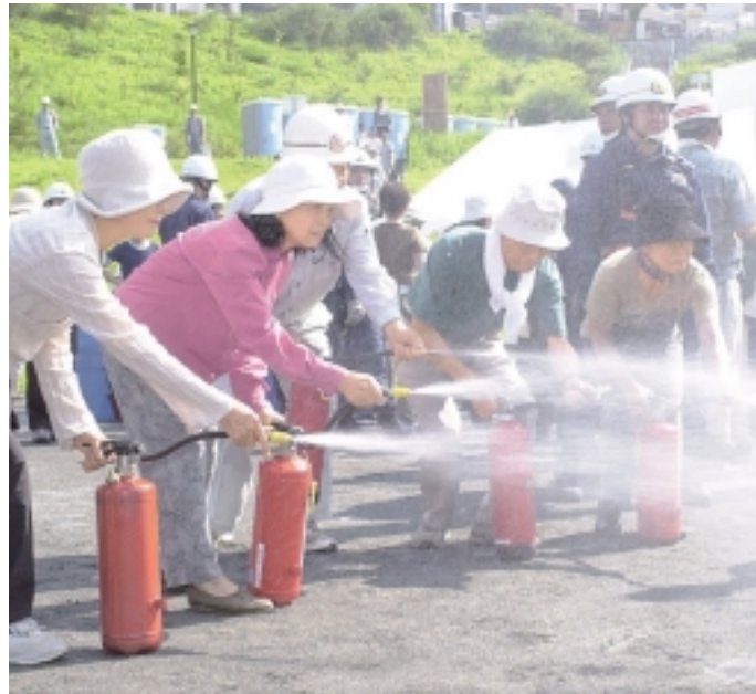
体験型訓練をしてみましょう

今年に入って、3月に能登半島地震、7月には新潟県中越沖地震と震度6強を観測し、多くの死傷者が出る地震災害が続けて発生し 年内に70%程度の確率で発生すると