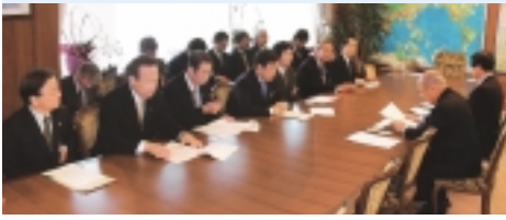
神奈川県知事、基地周辺市市長とともに緊急要請を行いました。1番左が石阪市長