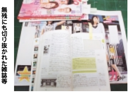
無残にも切り抜かれた雑誌等

何のために落書きするのでしょうか 法にのっとって貸出停止の処分を行っています。 図書館資料の切り抜き・書き込みなどはお止めください 本や新聞・雑誌に書き込みをする方がいます。鉛筆だけでなくボールペンやマーカー類を使って書き込みをしている例も見られます。また、部分的な切り抜きも多く見受けられます。こうした被害を受けた本の大半は廃棄せざるを得ません。