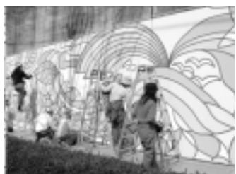
4月1日の仕上げ作業は、学生グループに地域の方々が行われました

多くの壁面は薬師池公園から徒歩2分程度のところにあります。お近くにおいでの際はぜひご覧下さい。この記事に関連した情報を町田ホームページにも掲載していますので、併せてご覧下さい。町田市ホームページ 市の組織別分類 建設部 道路管理課のコンテンツからご覧になるメニューをお選び下さい。なお、リーフレット「Michi」は町田市ホームページからダウンロードすることが出来ます。