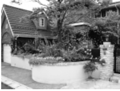
2006年度 花のまちかど大賞受賞作品

対象 市内の道路に面した花壇や鉢植え、植込みなどで、道行く多くの人たちが楽しむことのできる花飾りをされている方やグループ、店舗など、どなたでも参加できます（自薦・他薦を問いません）