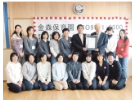
保育園職員も参加して授与式が行われました

金森保育園の品質方針「重点事項」 伝達の充実・強化 チェック(評価)の充実 子どもや保護者の満足度の向上