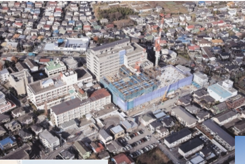
航空写真(2006年12月撮影)