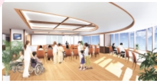
6階から8階までの病棟には、東棟と新棟を結ぶ中央部に食堂とダイナーを設け癒しの空間を創造します

外観は東棟と今回の増築部分がツインタワー状となり、間をつなぐ食堂部分についてはガラスカーテンウォールにより、空に溶け込んだ表現です。中央ホール部分については外観的に大きな開口をとり病院の顔として外部に開き明るいエントランスです。患者の利便性を優先するために1、2階は外来診療部門を配置します。1階には外来受付及び医事課、薬剤調剤を配置します。