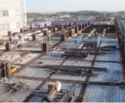
4階部分床コンクリート工事