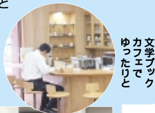
文学ブックカフェでゆったりと

1階は、町田ゆかりの文学者の著作や研究書、市民著作、その他雑誌、全集類、児童書などが収蔵され、資料閲覧室を備えた図書館機能を有しています。ここでは市立図書館の利用券を使って、資料を借りることができます(貴重資料を除く)。また、カフェを併設した文学サロンでは、コーヒーを飲みながらゆったりと「町田の文学」に触れることができますようになっています。