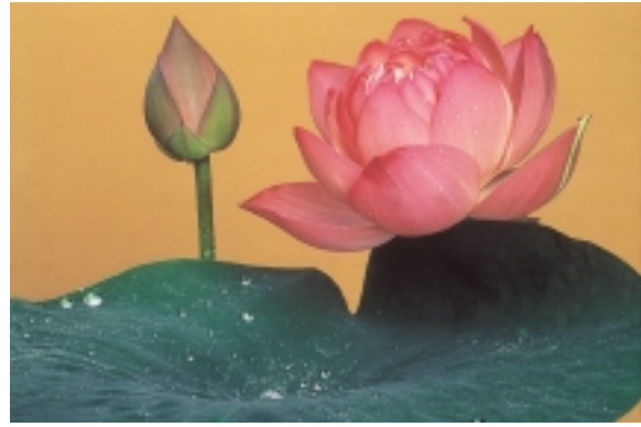
秋山庄太郎賞 タイトル「雨上がりのハス」花名：ハス 栗林栄市(新潟県三島郡)

10月28日、第5回秋山庄太郎記念「花」写真コンテスト入賞者発表 秋山庄太郎賞「雨上がりのハス」ハス・栗林栄市(新潟県三島郡) 町田市長賞「スイスの女王エリノ」エリノギウム・アルビヌム・中田勝啓(東京都町田市) 町田市長賞「蓮」ハス・上野きよ子(新潟県新潟市) 富士フイルムイメージング賞「風月花」シダレザクラ・近藤金蔵(新潟県佐渡市) 日本フォトコンテスト賞「稚児車」チングルマ・坂井征栄(新潟県新潟市) 写真弘社賞「五姉妹」ヒメサユリ・小出公司(新潟県新潟市) クリエイト賞「月下美人」ゲッカビジン・小松和夫(東京都町田市) フレームマン賞「チューリップ」チューリップ上栄子(新潟県新潟市)