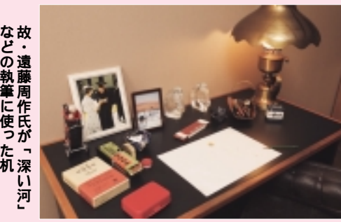
故・遠藤周作氏が「深い河」などの執筆に使った机