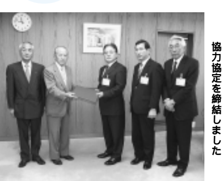
協力協定を締結しました

市では、社団法人東京都自動車整備振興会町田支部と「災害時における応急活動に関する協力協定」を締結し、10月20日に調印式が市役所で行われました。この協定は地震や風水害などの大規模災害時に障害物の除去、緊急自動車等の整備などの応急活動を要請に基づいて行なうことを定めたものです。問 防災課 ☎724・3075