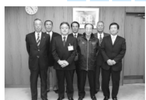
町田メイツの皆さんと市長

10月28日から31日までに開催された、全国健康福祉祭「ねんりんピック」に町田市ソフトボール連盟所属のシニアチーム「町田メイツ」が東京都代表として出場することに10月24日、市役所に報告に訪れました。この大会では全国から集まった64チームが出場。