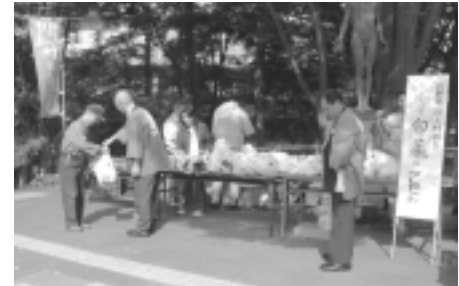
とれた白菜をプレゼント

町田市と友好関係にあり、市の自然休暇村がある長野県川上村から10月31日、白菜約600個が届けられました。