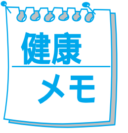
(町田市歯科医師会)

受診期間 基本健診は原則とし て誕生日とその翌月、子宮がん検 診は通年(どちらとも年度内)