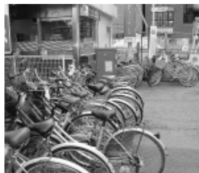
駅前の放置自転車

【自転車対策】 1億3484万2千円 放置自転車対策委託、自転車駐車場管理委託、自転車駐車場建設費負担金など。 【違法駐車対策】 3426万9千円 違法駐車等防止指導委託など。 【交通輸送対策】 9640万8千円 市民バス・地域コミュニティバス運行事業補助など。