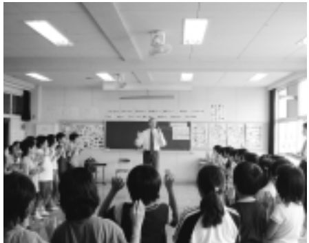
英語の授業を受ける南成瀬小学校4年生

【学校給食の運営】 (小)2億5305万3千円 (中)1億3921万円 小学校40校に加え、中学校8校の給食を実施する。 【学校施設の整備】 (小)7億2469万7千円 (中)7億6196万7千円 堺中学校の体育館・プール改築及び校舎の増築事業。 小・中学校の耐震補強工事、防犯カメラの設置工事、学校ネットワークの整備委託など。 【大規模改造】 4億7932万4千円 忠生中学校大規模改造・耐震補強工事